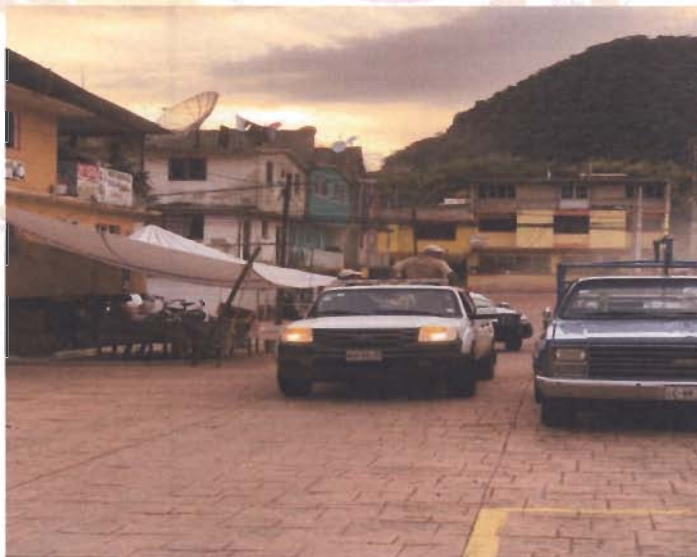
Fumigación en la Comunidad de Plaza Nueva Ocuilan.