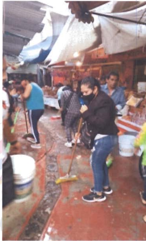
Lavado en la comunidad de Plaza Nueva