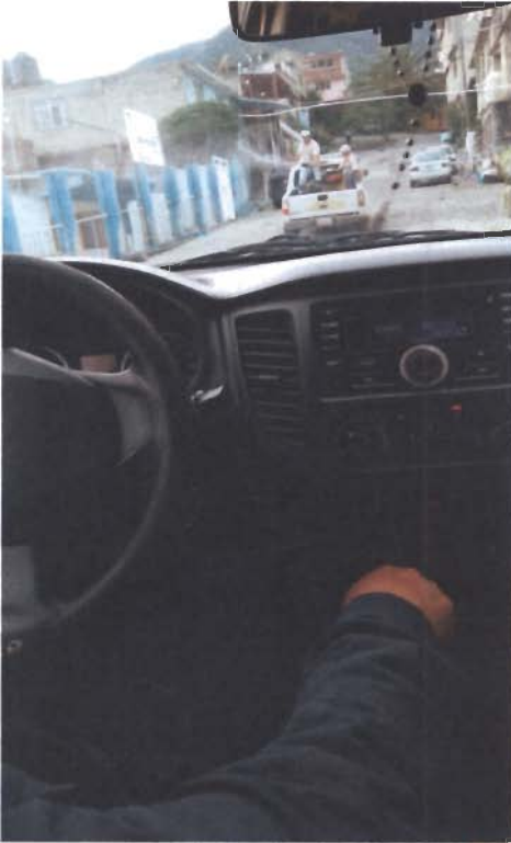
Fumigación en Plaza Nueva Ocuilan.