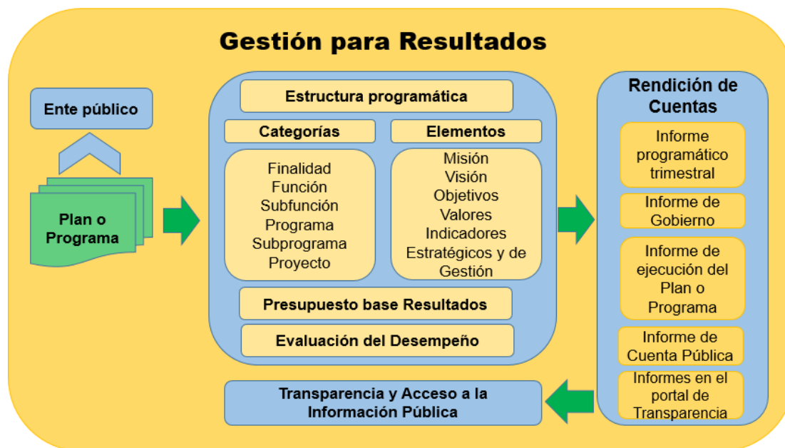
Figura No. 1 Subsistema del PbR y el enfoque del Sistema de GpR .

Elaboración de la Consultoría, con base a la interpretación de los instrumentos de planeación, programación y presupuestación 2019.